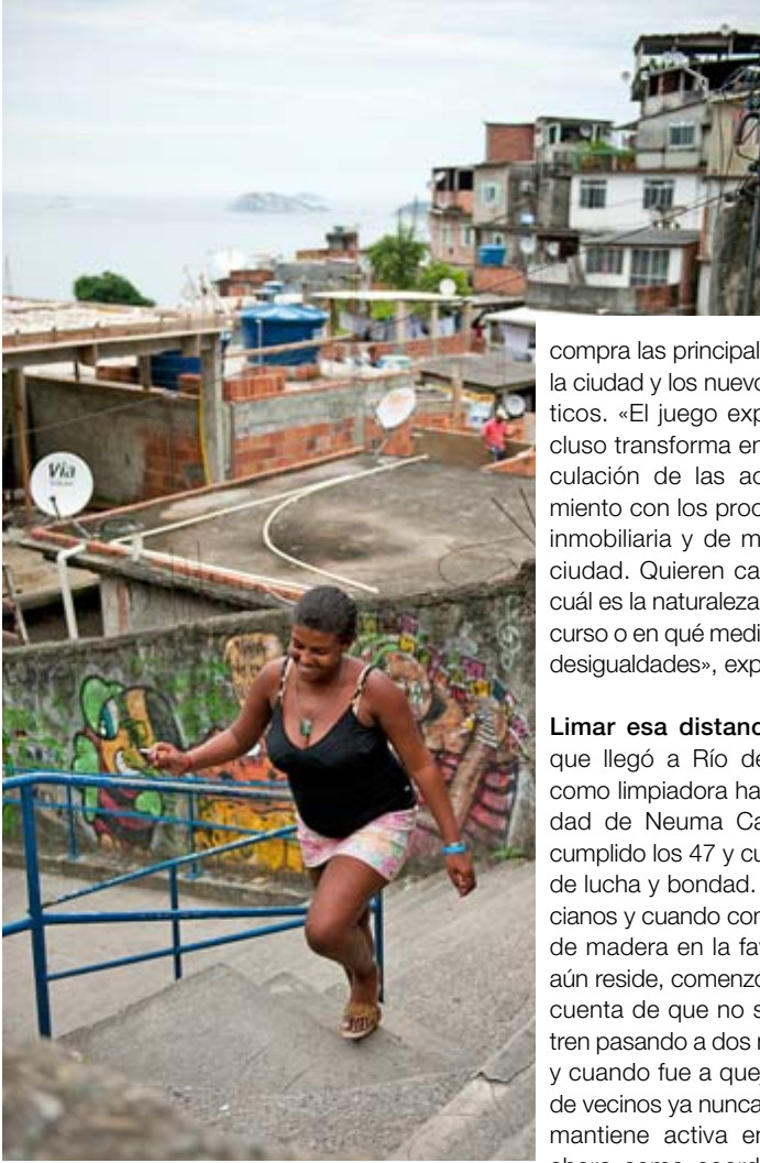
De arriba abajo: Familia con niños en el portal de su casa, en Vidigal. Una joven en la misma zona.