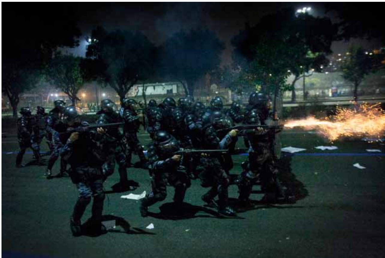
I juni væltede brasilianerne ud på gaderne i demonstrationer. Her skyder anti-oprørsstyrker med gummikugler mod en folkemængde, der i Rio De Janeiro 20. juni protesterede over stigende buspriser.