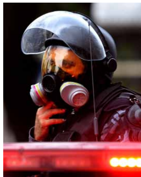
Anti-oprørsstyrker holdt skarpt øje med den utilfredse folkekemængde, da Brasilien 30. juni vandt Confederations Cup-finalen mod Spanien med 3-0.

I DAG PATRULJERER UPP-enheder i 33 favelaer i Rio de Janeiro, og flere er på vej. Narko-handlen er ikke forsvundet, men i modsætning til før er den diskret, og der er ikke længere bevæbnede bander på gaderne. Er det en succes?