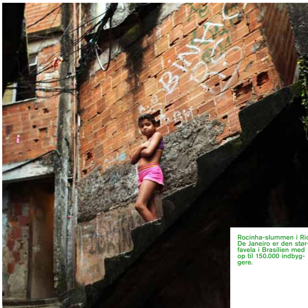
Rocinha-slummen i Rio De Janeiro er den stør-favela i Brasilien med op til 150.000 indbyggere.

Billede 1&2: Brasilien vinder VM i fodbold i 2002 i Japan. Billede 3: Brasiliens daværende præsident Luiz Inácio Lula da Silva fejrer i 2009 i Bella Center i København, at Brasilien og Rio de Janeiro har vundet OL-værtskabet i 2016 over byer som Chicago, Madrid og Tokyo.