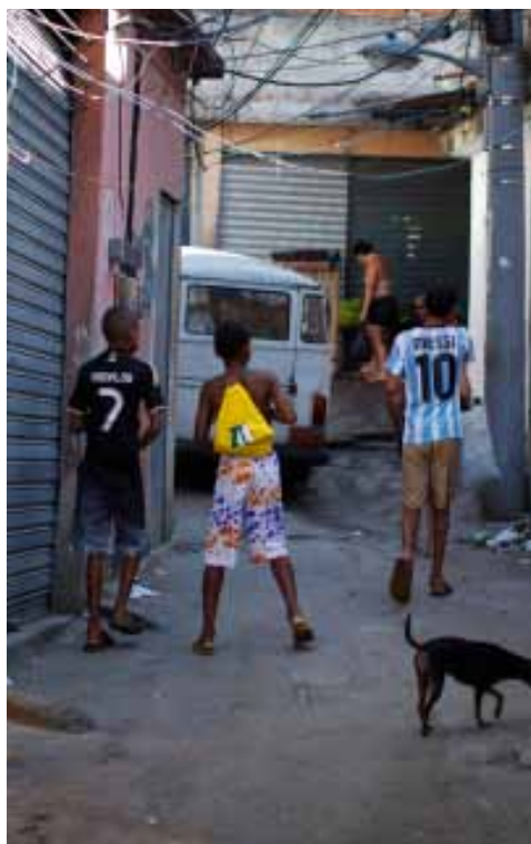
Hvem er bedst? Ronaldo til højre eller Messi til venstre? Tre børn i en gade i Complexo do Alemão-favelaen i Rio De Janeiro.

Måske ligger noget af den følelsesmæssige forklaring i fortiden: Maracanã var verdens største stadion, da det blev indviet til verdensmesterskaberne i fodbold i 1950. Dengang overværede 200.000 forventningsfulde tilskuere Brasilien